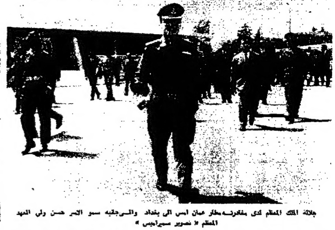
جلالة الملك المظفر لدى مغادرته مطار عمان أمس إلى بغداد والرجوع به سمو الأمير حسن ولي العهد المظفر

بغداد - بدأت المباحثات الرسمية بين الحائنين العربي والعراقي في الساعة الخامسة والتربع من مساء أمس في قصر الجمهوري - ونائب الرئيس العراقي الملك الحسين المظفر، وضمه سمو الأمير حسن وفي أعقاب المحطة والديبلوماسية الشريفة رئيس الوزراء والوزير المساعد للشؤون الخارجية والوزير المساعد للشؤون العربية في العراق.